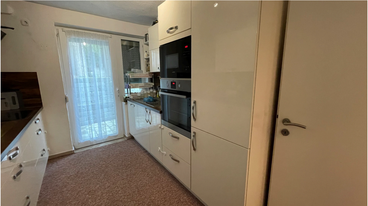
Küche mit neuwertiger EBK